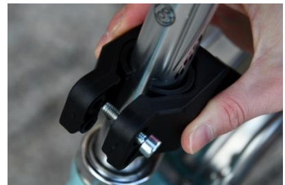
Abstandhalter zu groß !!!

Da die Sattelstangen unterschiedliche breiten haben liegen Abstandhalter bereit, damit die Kupplung später richtig sitzt. Die Abstandhalter werden jeweils in die beiden Hälften der Kupplung eingelegt.