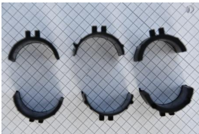
3 verschiedene Größen