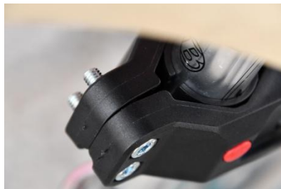
Abstandhalter passt ✓